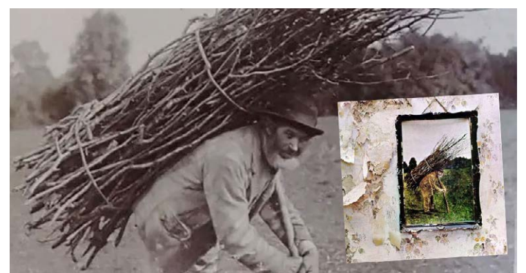
Mistério do homem da capa do 4º LP do Led Zeppelin é resolvido após 50 anos