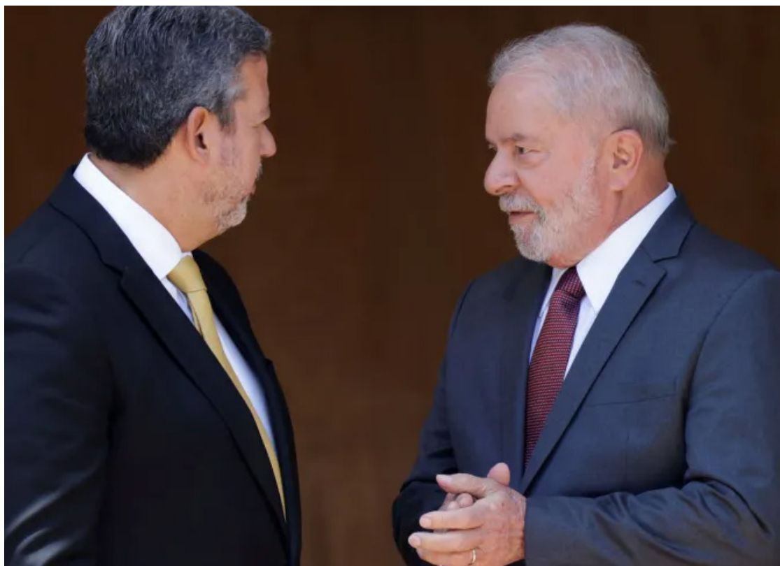
Arthur Lira e Lula da Silva: governo de coalizão, com distribuição de ministérios

O cenário passa pelo uso político das sessões híbridas, que admitem a participação via internet; a diminuição dos instrumentos da minoria para