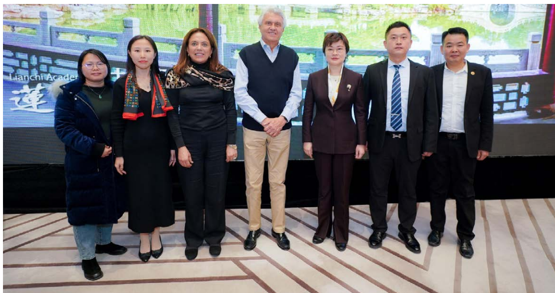
Governador em metrópole chinesa que está sendo construída com ciência e tecnologia avançadas

A resposta foi positiva. Em discurso, Jin Hui enfatizou que o desenvolvimento e a cooperação em benefício mútuo estão no foco de Hebei e que devem ganhar novo ritmo a partir de agora, com relações mais estreitas. “Queremos aprofundar a cooperação com os domínios de planejamento urbano, construção de infraestrutura e tecnologia da informação. Será uma parceria estratégica”, afirmou ela, lembrando que os presidentes do Brasil, Luiz