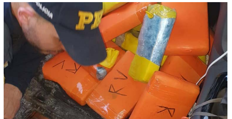
Droga encontrada no veículo apreendido

Durante uma abordagem da polícia, o carro recebeu ordem de parada porque a criança era transportada sem utilizar o dispositivo de retenção. Na fiscalização, os agentes encontraram cerca de 52 quilos de pasta base e de cloridrato de cocaína, escondidos nas partes ocultas do veículo. O casal então foi preso e encaminhado à Central de Flagrantes local.