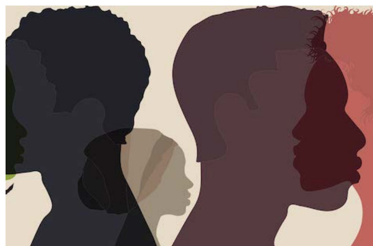
Desigualdade racial nos partidos brasileiros é mais intensa entre as mulheres

Para chegar a esses números, o estudo usou o Repositório de Dados Eleitorais do TSE (Tribunal Superior Eleitoral), em que são divulgados microdados das eleições e que reúne características dos candidatos — como gênero, idade, ocupação e patrimônio declarado — e, desde 2014, a raça autodeclarada.