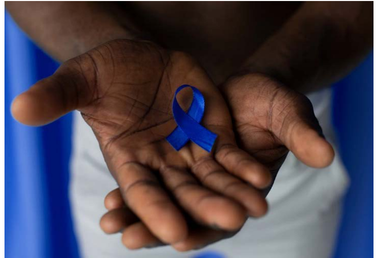
Ação tem o intuito de ofertar orientações de prevenção ao câncer de próstata, em todas as regiões do município de Mineiros.

De acordo com o Instituto Nacional do Câncer (Inca), no Brasil, o câncer de próstata é o segundo mais comum entre os homens, atrás apenas do câncer de pele não melanoma.