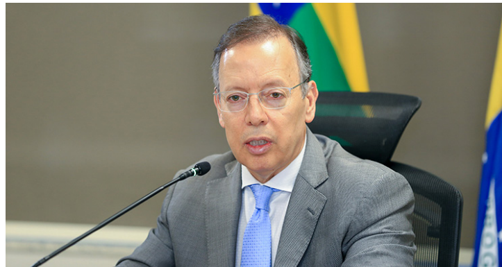
Carlos França: fortalecimento da Justiça nos estados