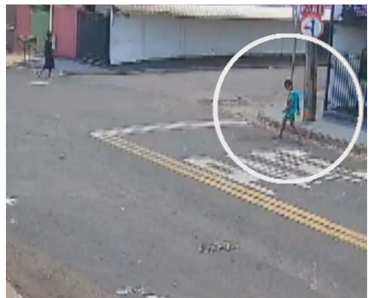
Imagem de câmera de segurança mostra menino no dia em que desapareceu

Segundo o delegado, no dia em que a família alegou que a criança depereceu após deixar o irmão na escola, ele retorna sentido à residência que não é tão longe. "Inclusive nas imagens captadas, ele está próximo de casa", relata.