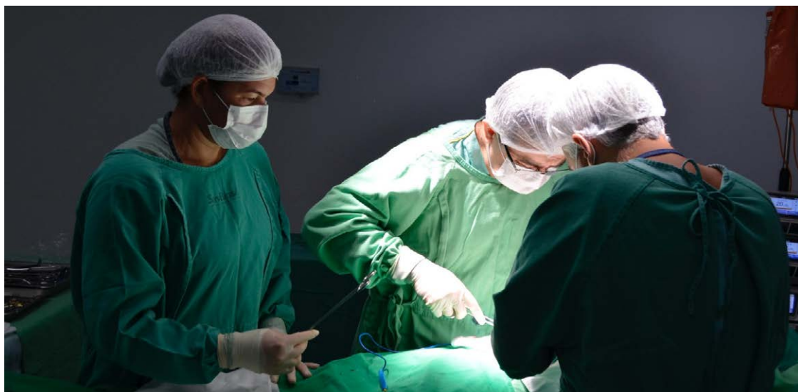
Profissionais do HCN, unidade do Governo de Goiás em Uruaçu, durante a captação de rins em doador de 59 anos que teve morte encefálica

Entre os doadores estão um homem de 34 anos do qual foram captados rins e córneas;