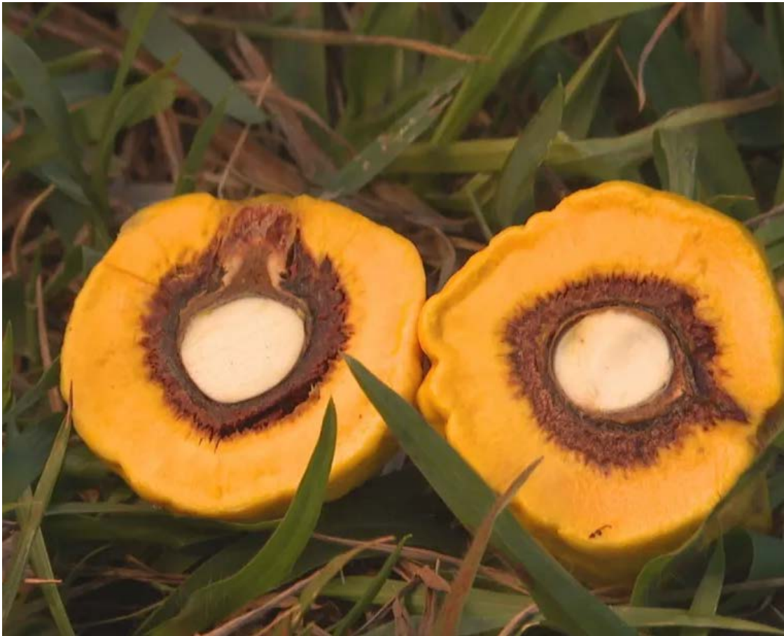
A espécie, criada nos viveiros da Emater-Goιάs, faz grande sucesso

A Agência Goiana de Assistência Técnica, Extensão Rural e Pesquisa Agropecuária (Emater) e a Embrapa Cerrados lançaram neste mês seis novas variedades de pequi